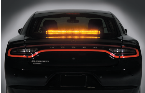
يُعرض SIFMJR على مركبة دودج تشارجر موديل 2018