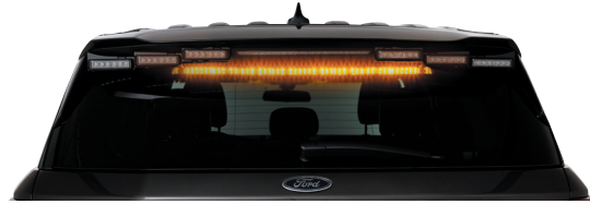
يُعرض SIFMJH على مركبة فورد إنترسبتور يوئلتلي لعام 2020