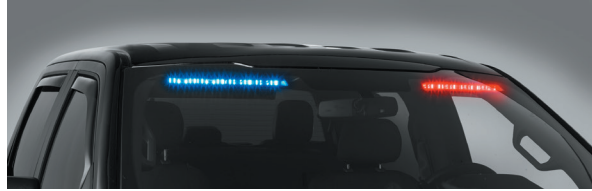
يُعرض SIFMSJ على مركبة فورد F-150 ريسبوندر موديل 2019