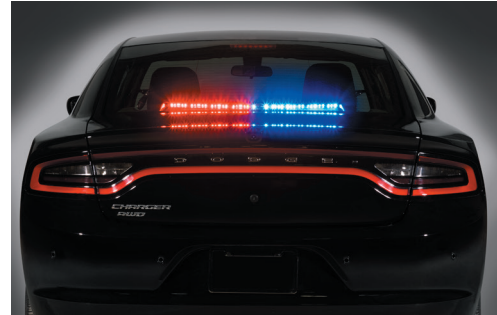
يُعرض SIFMJR على مركبة دودج تشارجر موديل 2018