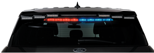
يُعرض SIFMJH على مركبة فورد إنترسبتور يوئلتلي لعام 2020