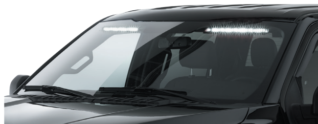
Se muestra el SIFMJS en un Ford F-150 2019